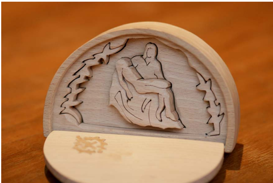
Lesena sestavljanica, avtor Boštjan Meglič