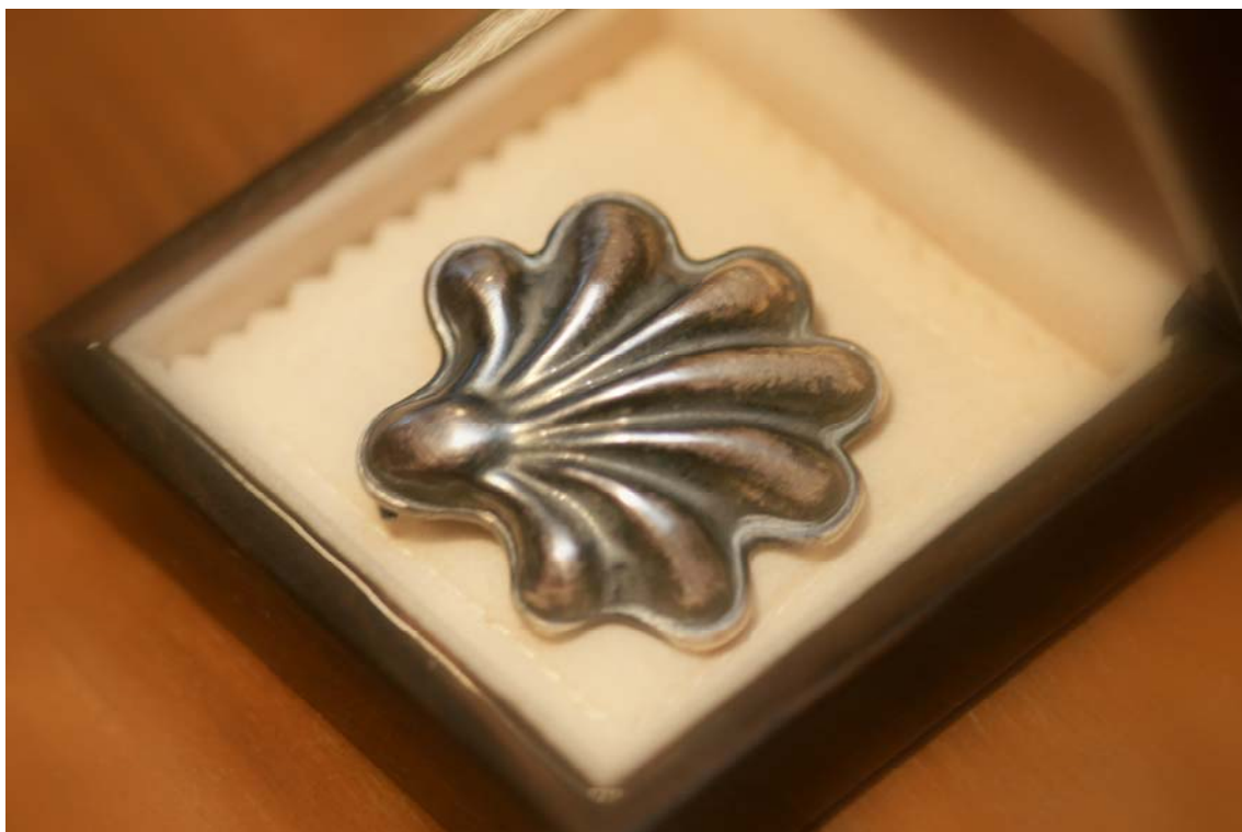
Jakobova školjka, avtorica Marjeta Pikelj, izdelava Zlatarne Celje