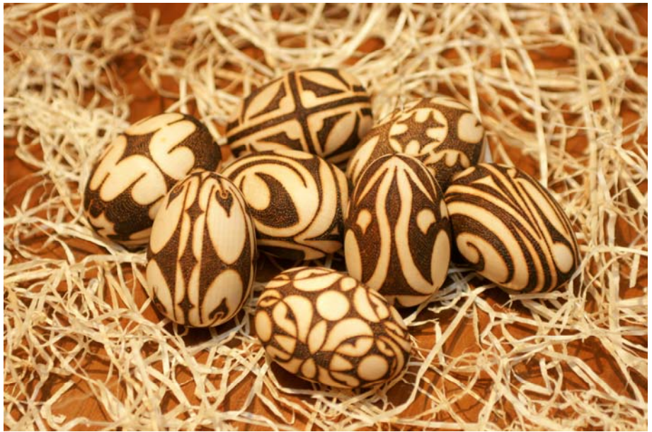
Vžiganice, avtor Matevž Maretič